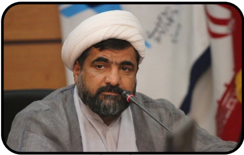
معاون دانشجویی و فرهنگی دانشگاه آزاد اسلامی یزد: